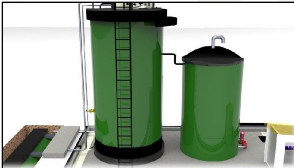
WASTE WATER TREATMENT