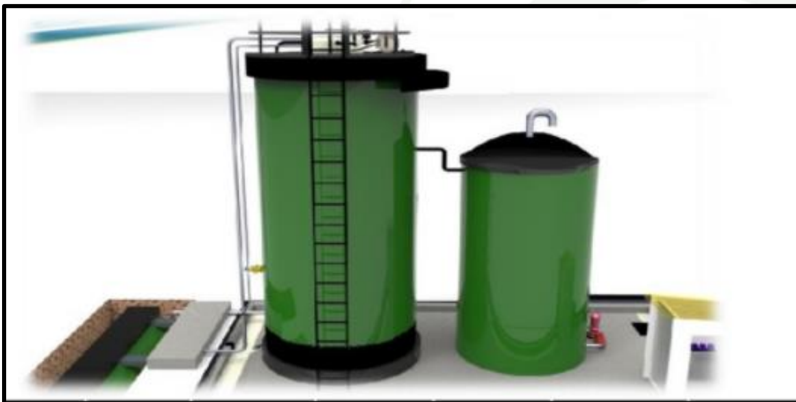
TRATAMIENTO DE AGUA RESIDUAL